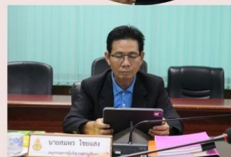
ข่าว : ณัฐธยาน์ เขียวทอง